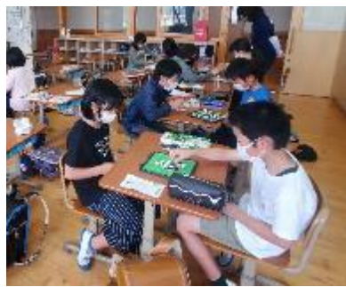
ゲーム・イラストクラブ

クラブ活動は、毎月1回木曜日の6校時目に、4～6年生の児童が、共通の興味・関心を追求する活動を自発的・自治的に行うことによって、自主性や社会性を養い、個性の伸長を図ることを目的としています。