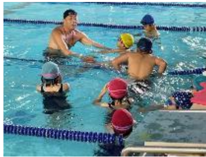
島コーチによる指導