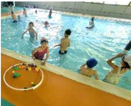
水中の玉を拾う1年生

今年は、6月と7月の2回に分けて、五島市民三井楽プールにて、水泳の学習を行います。「自分の命は自分で守る」ため、自分の目標に合わせて水に慣れ、泳ぐことができるよう、学年や泳力に応じたグループで学習を進めています。