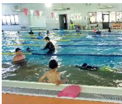
島コーチによる指導