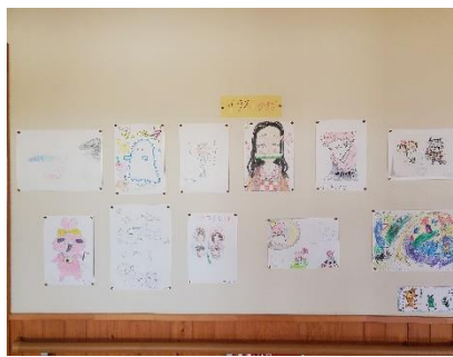
ゲーム・イラストクラブ

子供が楽しみにしているクラブ活動は、毎月1回60分間で行っています。家庭科クラブは、プラスチック板に絵を描き、オーブントースターで焼き、キーホルダーを作りました。パソコンクラブはデザインや色を工夫した名刺を作り、印刷しました。スポーツクラブはキックベースボールの試合を楽しみました。ゲーム・イラストクラブはキャラクターを描いた作品を完成させました。