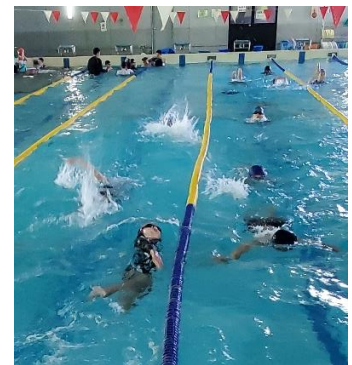
5・6年生のリレー競争