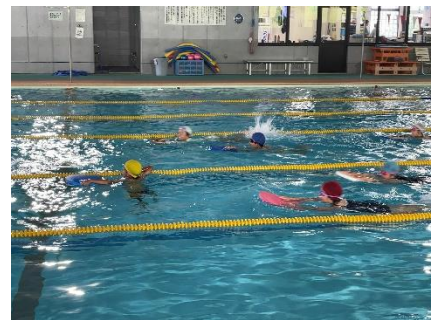
ビート板で泳ぐ3・4年生