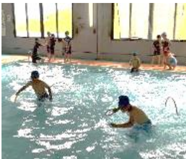
2年生の輪くぐりリレー