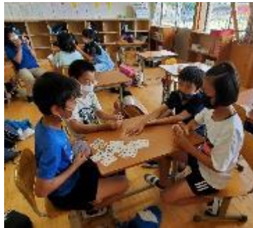
ゲーム・イラストクラブ

1学期最後のクラブ活動。家庭科クラブは、飾りの色や形を工夫しながらヘアピンを作りました。パソコンクラブはそれぞれ自分の興味のあるテーマを決めて、調べたことを新聞にまとめています。スポーツクラブはドッジボールのゲームを楽しみました。ゲーム・イラストクラブは4グループに分かれ、担当の先生も一緒になりトランプを楽しみました。