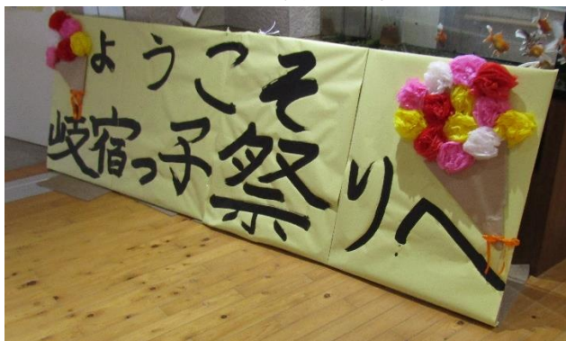
運営委員会委員が協力・分担し制作